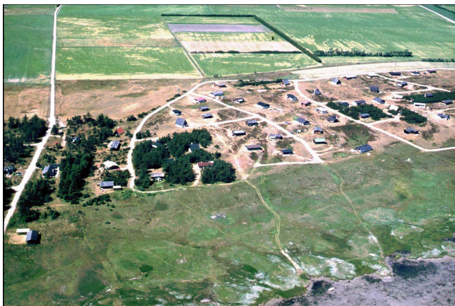
4.Ved Dicks grunde i syd