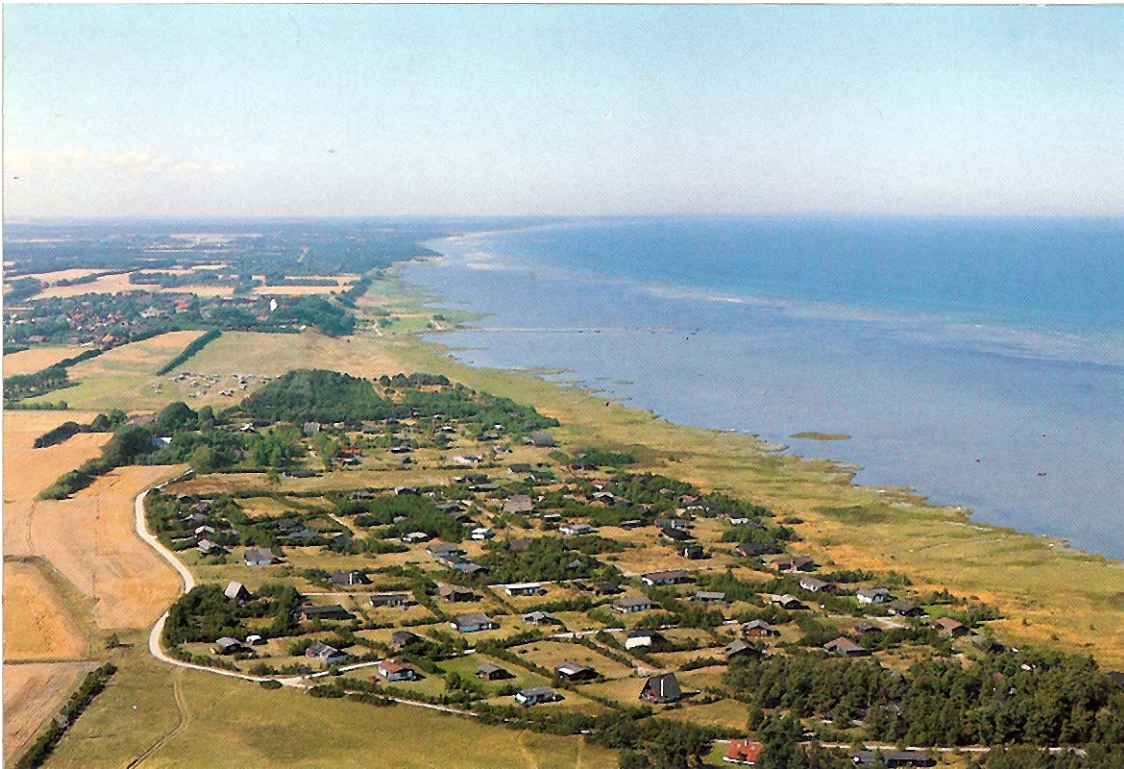
Postkort over Halvrebene set op mod Als fra ca. 1980