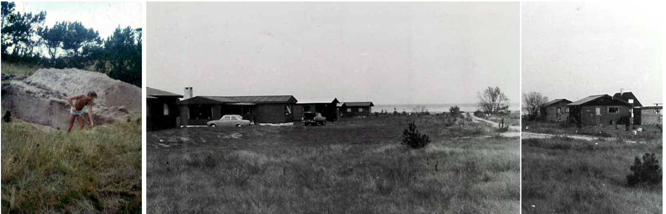
Udgravning til hus 1967 - og sådan så der ud i 1976 ved Halvrebene 22 til 34 set fra nr. 22 mod "hæwet".

De fleste sommerhuse er opført som enetages træhuse med træskelet beklædt med lodrette eller vandrette brædder. Enkelte som bjælkehuse og ganske få som murede – i gasbeton eller traditionelt murværk – og kun ganske få i 1½ etage - med udnyttet tagrum. De fleste med eternittag, enkelte med build-up / tagpap, nogle få med stråtag.