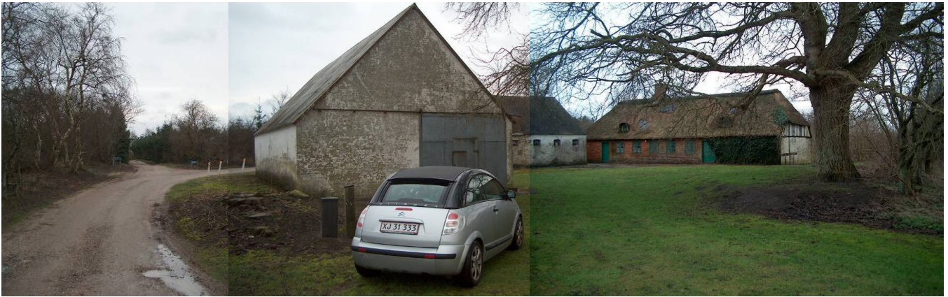
Gårdens bygninger er nedbrudt efter år 2007 - og nu ligger her i stedet et sort sommerhus i bjælketræ.