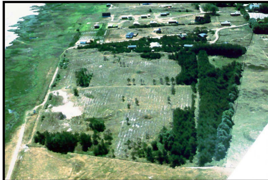
2.Præstegårdsplantagen efter branden (vist i 1970)